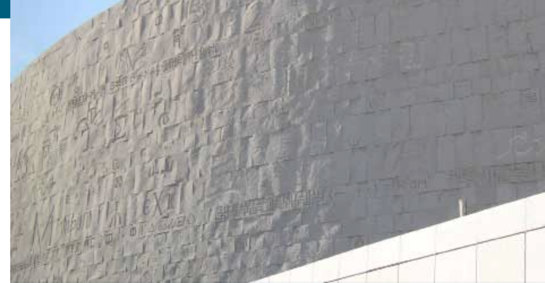
Nouvelle bibliothèque d'Alexandrie (murs des écritures) - Copyright Alain Guilleux "Une promenade en Egypte"